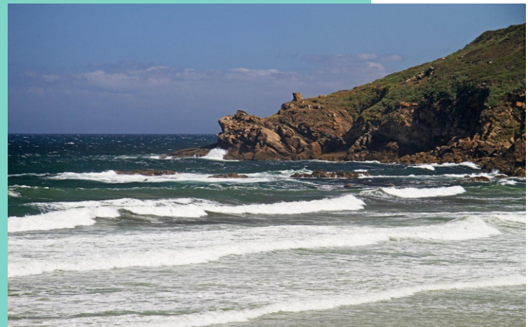
A Atalaia. Punta da Chan.