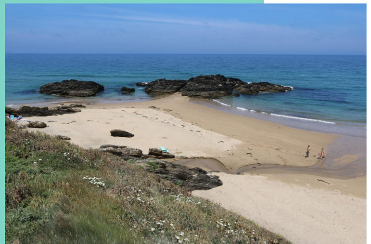
O Gaiteiro (Praia das Torradas)