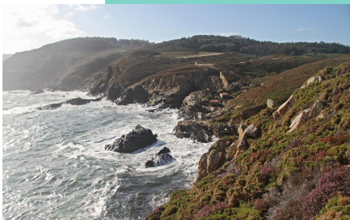
Enseada, Laxe e punta dos Muíños