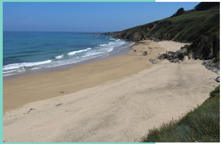
Praia das Torradas