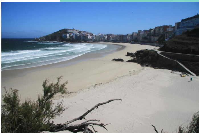
Praias de Canido e Area Maior