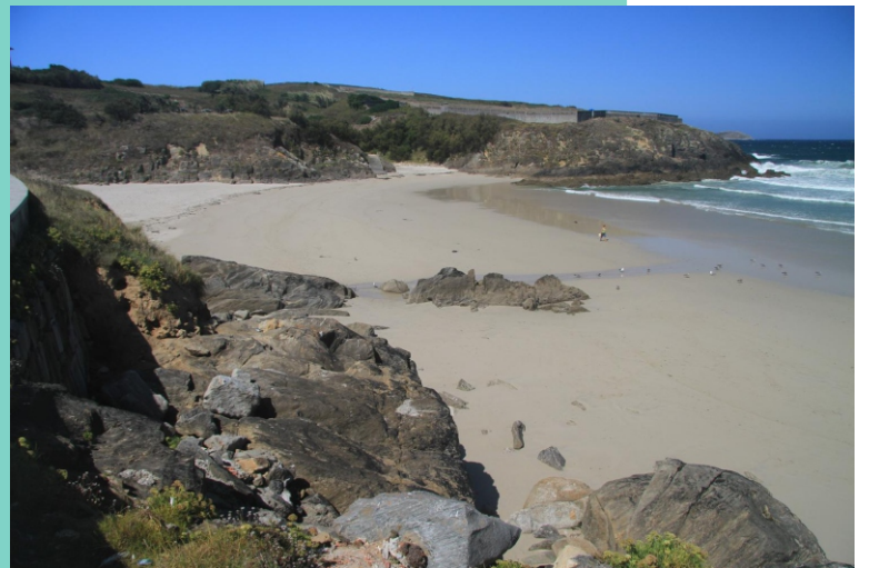
Praia e punta de Canido