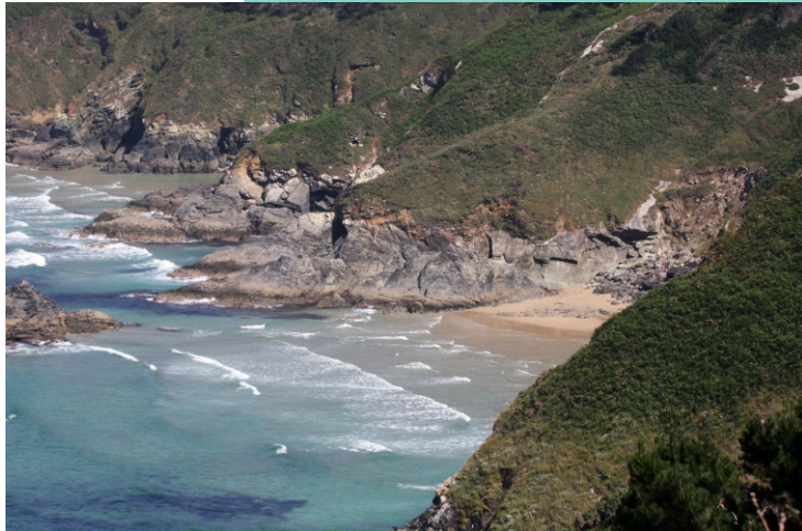
Praias, illa e rego da Rega