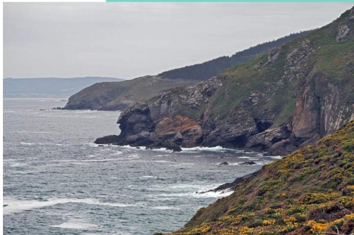
Praia dos Curros