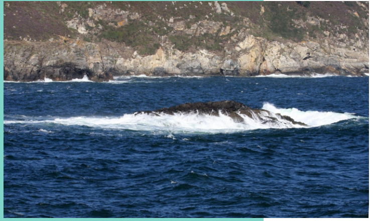
Punta Lapachán. Illa Redonda.