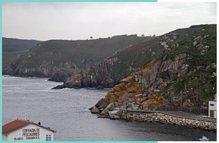
Punta da Plancha