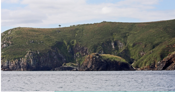
Illa do Castelo