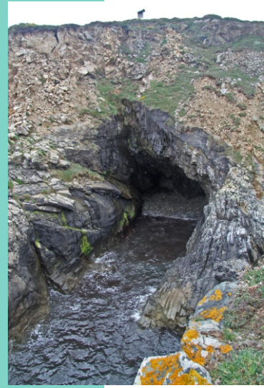
Punta dos Muíños