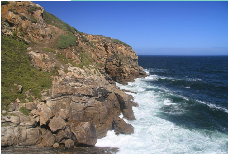
A Atalaia. Punta da Cuada