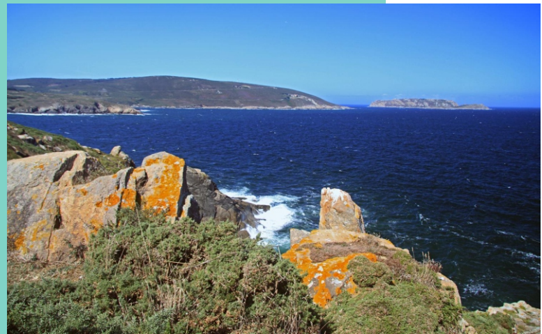
A Atalaia. Punta da Chan.