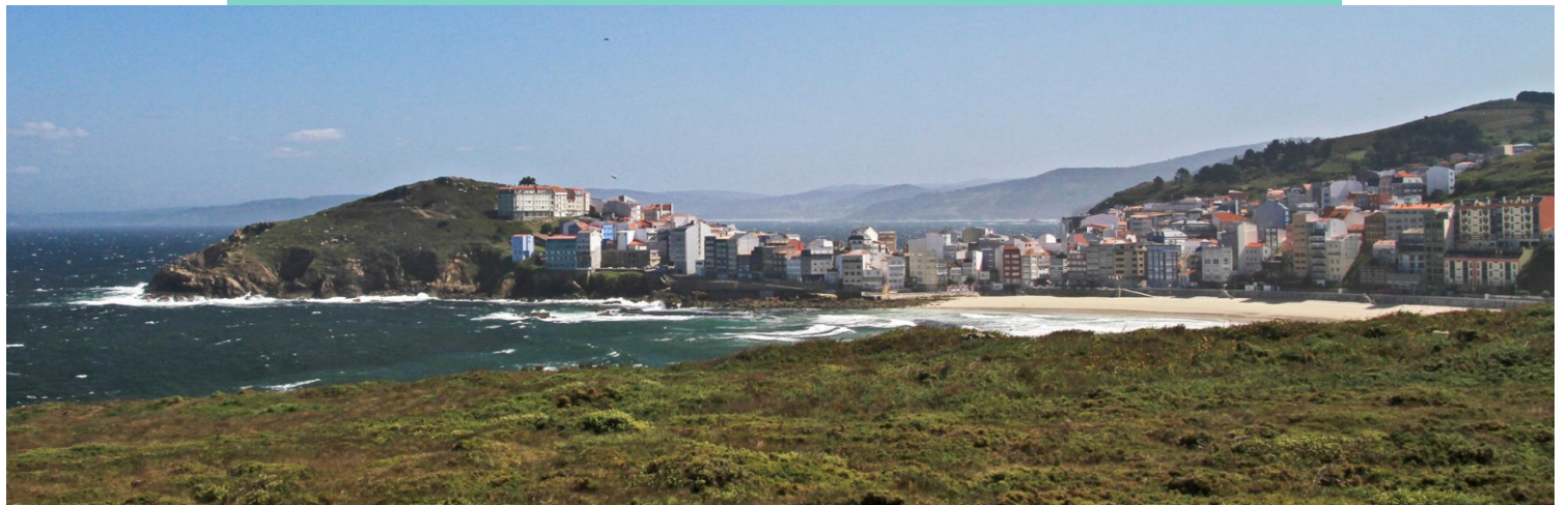
Praia de Area Maior e A Atalaia