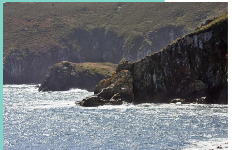
Punta do Muxeiro