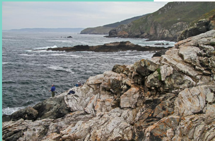
Laxe e punta dos Muíños