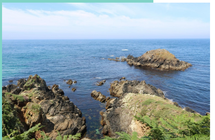
Punta do Angueiro e Illote de San Bartolomeu