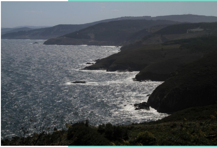
Vista da costa norte de Malpica