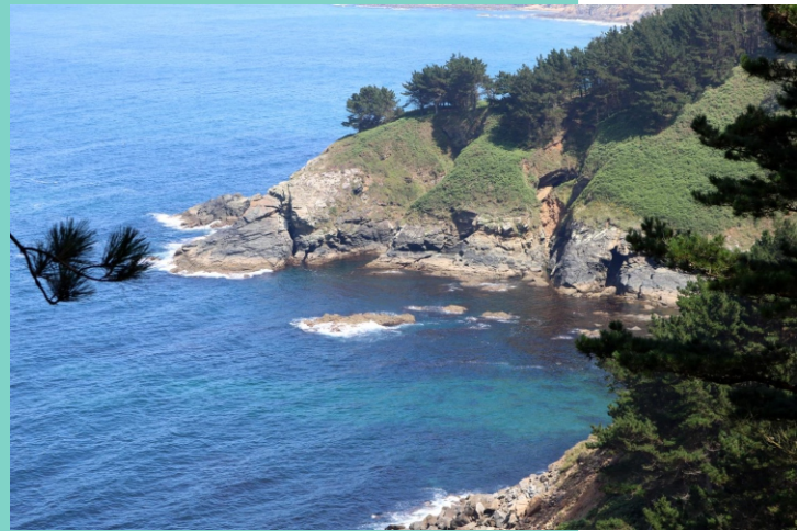
O Cociñadoiro punta dos Guichos e Pedra Negra