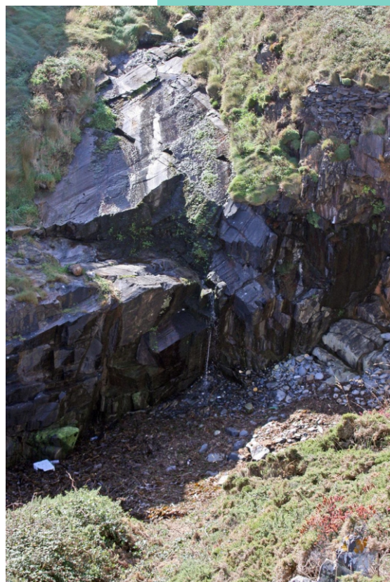
Furna e rego da Xareira