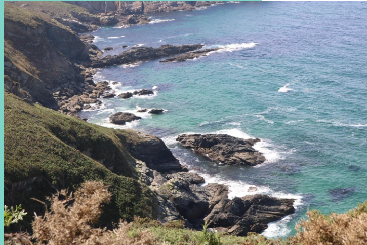
Punta e illote Pepino