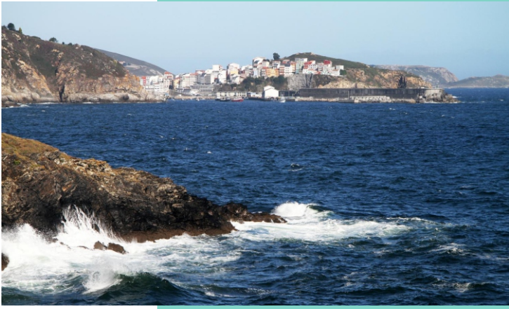
Punta do Boi, con Malpica ao fondo