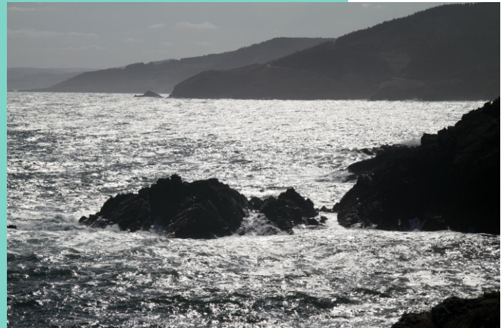
Punta de Fuxín