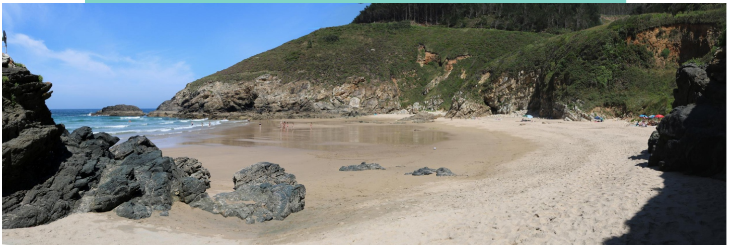
Praia de San Miro