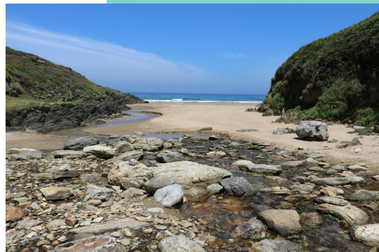
Praia dos Riás